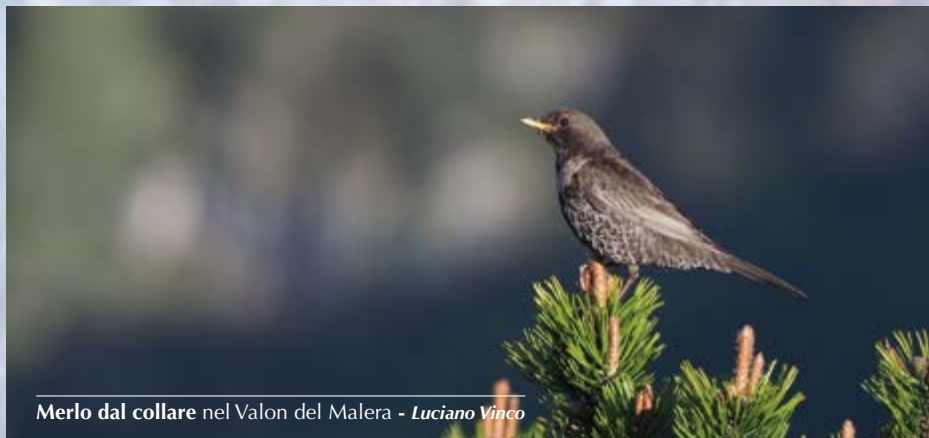
Merlo dal collare nel Valon del Malera - Luciano Vinco

1 ind. a San Giorgio il 26.10 (L. Vinco).