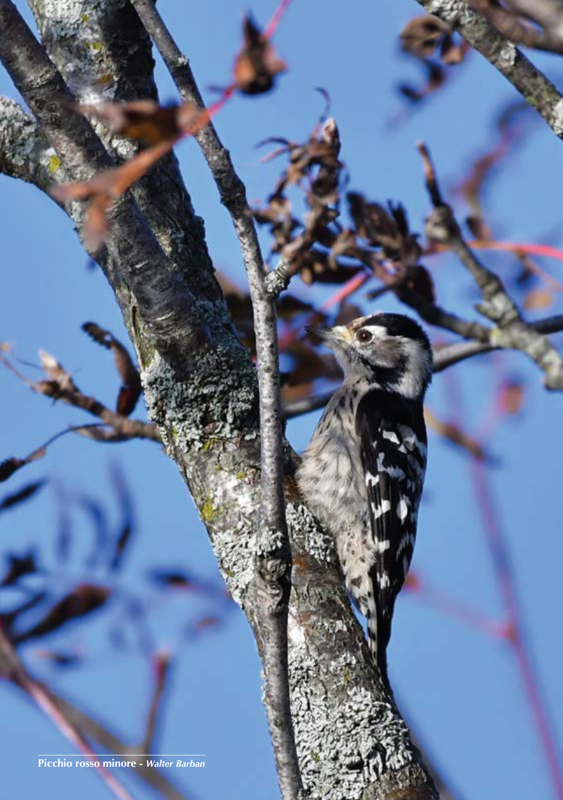
Picchio rosso minore - Walter Barban