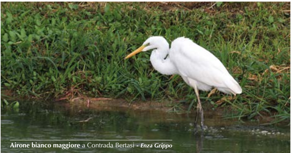
Airone bianco maggiore a Contrada Bertasi - Enza Grippo

1 ind. a Contrada Bertasi il 24.08 (E. Grippo).