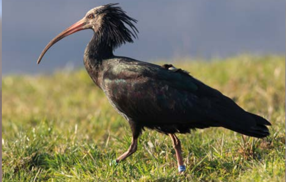
Ibis eremita a Corrubio - Luca Signorini

2-7 indd. tra Cerro Veronese e Corrubio di Grezzana tra il 20.12 e gennaio 2020 (E. Pighi, L. Signorini, V. Corradi, L. Signori et al. ).