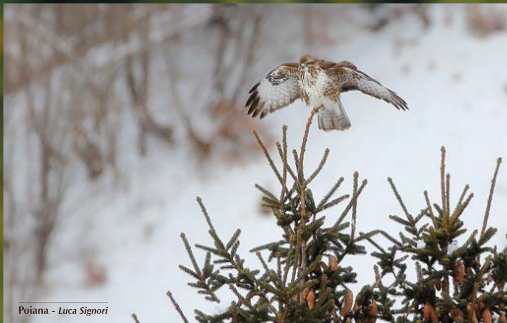
Poiana - Luca Signori