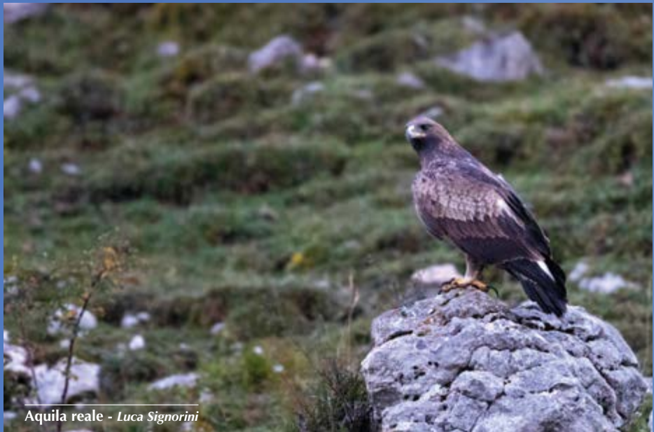
Aquila reale - Luca Signorini

2 indd. su predazione di lupo il 17.10 (L. Signorini).