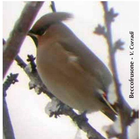
Beccofrusone - V. Corradi

Bombycillidae Beccofrusone Bombycilla garrulus