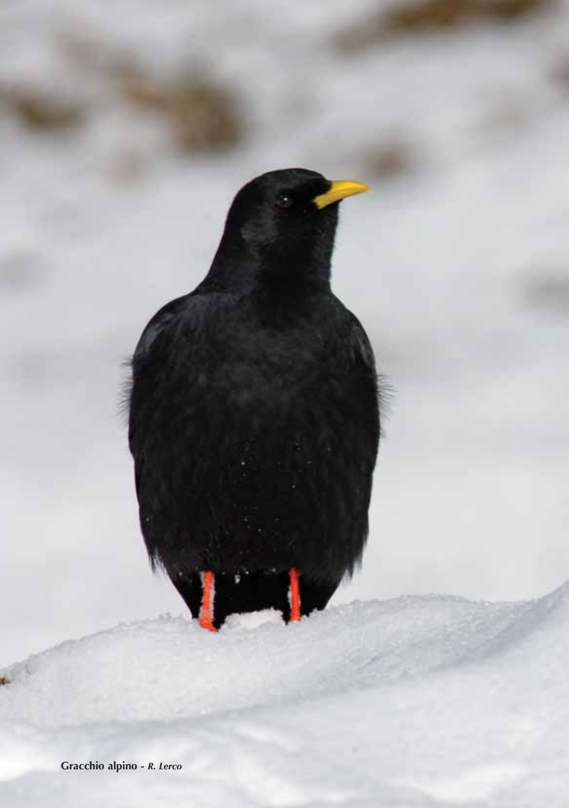
Gracchio alpino - R. Lerco