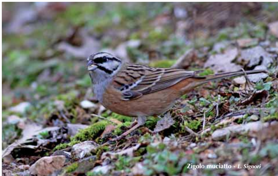
Zigolo muciatto - L. Signori

1 ind. a Piazzoli, Selva di Progno, l'8.01 (L. Signori).