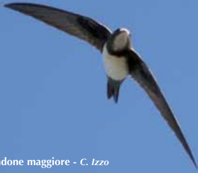
Rondone maggiore - C. Izzo

Cuculiformes Cuculidae Cuculo Cuculus canorus