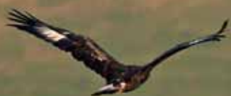
Aquila reale - P. Parricelli