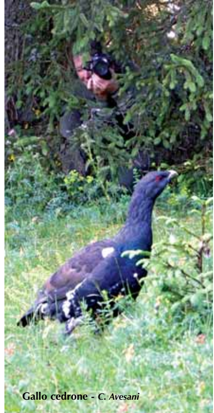
Gallo cedrone - C. Avesani