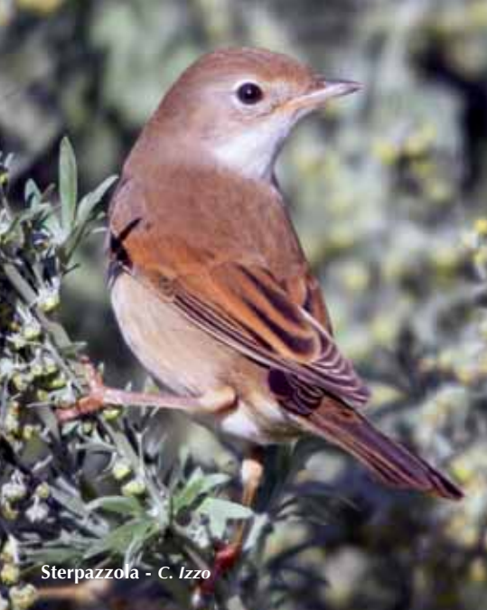
Sterpazzola - C. Izzo