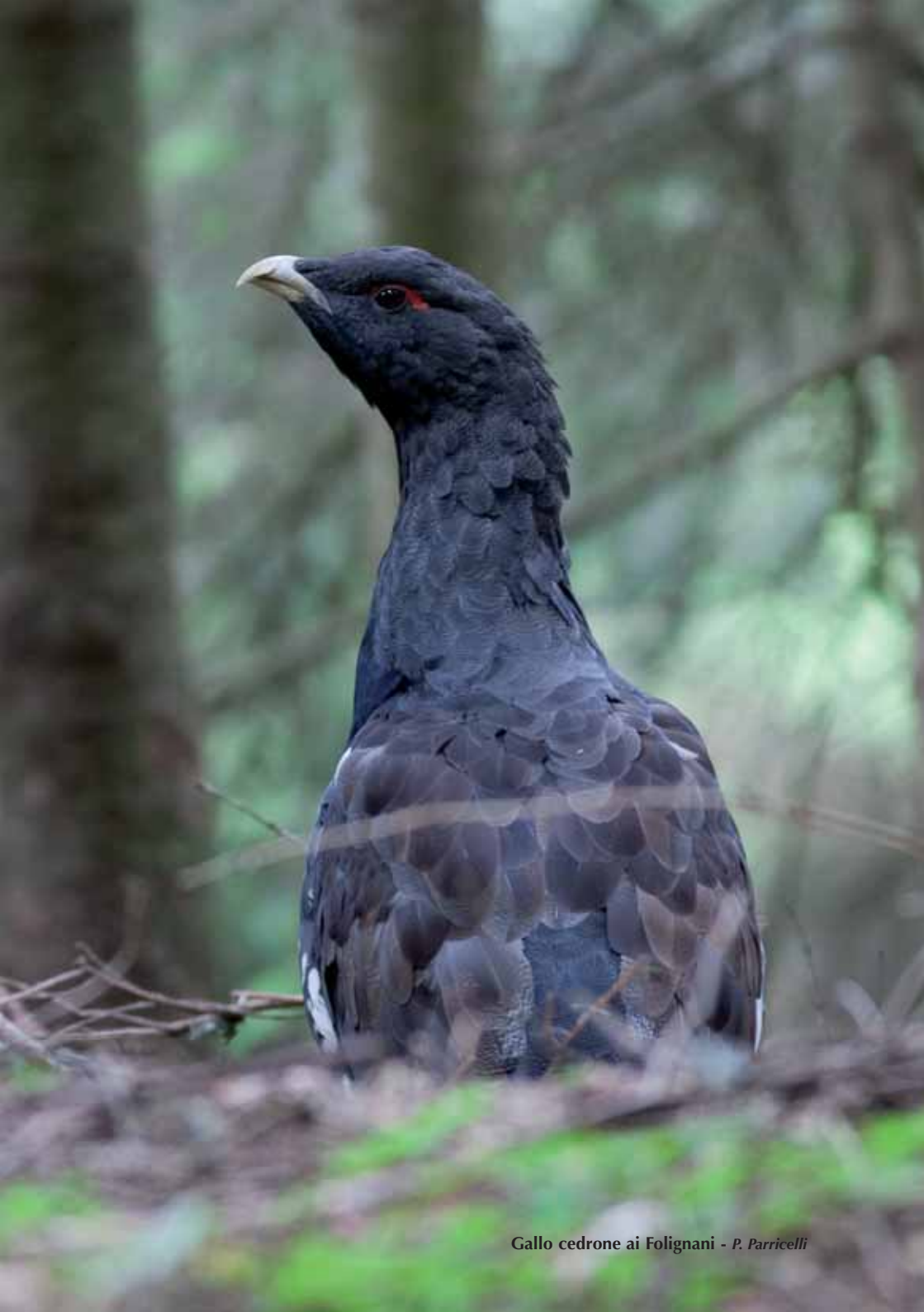
Gallo cedrone ai Folignani - P. Parricelli