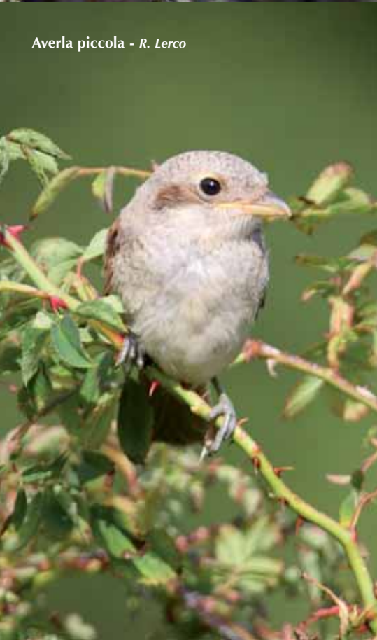
Averla piccola - R. Lerco