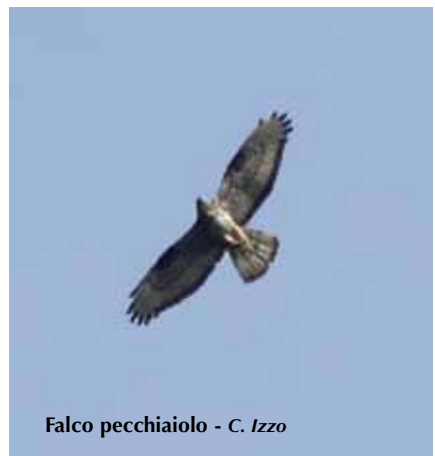
Falco pecchiaiolo - C. Izzo