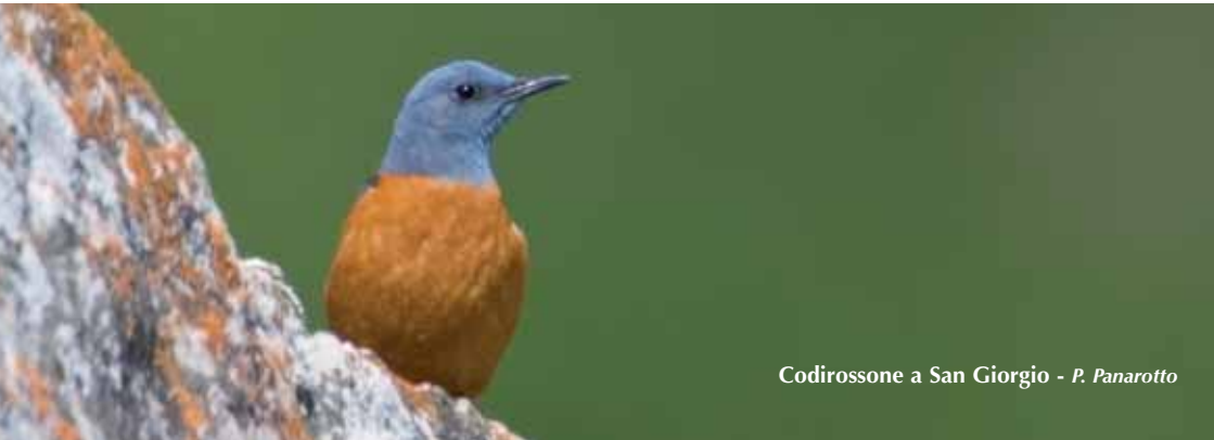
Codirossone a San Giorgio - P. Panarotto

1 cp. a Branchetto tra giugno ed agosto, osservata 1 f. con imbeccata a fine giugno e 1 juv. il 23.07 (R. Lerco, M. Bertacco, V. Fanelli, C. Izzo).