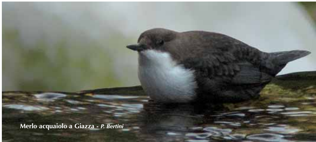
Merlo acquaiolo a Giazza