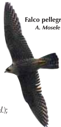
Falco pellegrino A. Mosele

1 ind. al Pigarolo il 2.12 (P. Parricelli).