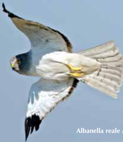
Albanella reale a Martelletti - P. Panarotto