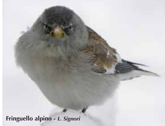
Fringuello alpino - L. Signori

Passeridae Passera d'Italia Passer domesticus italiae Passera mattugia Passer montanus Fringuello alpino Montifringilla nivalis